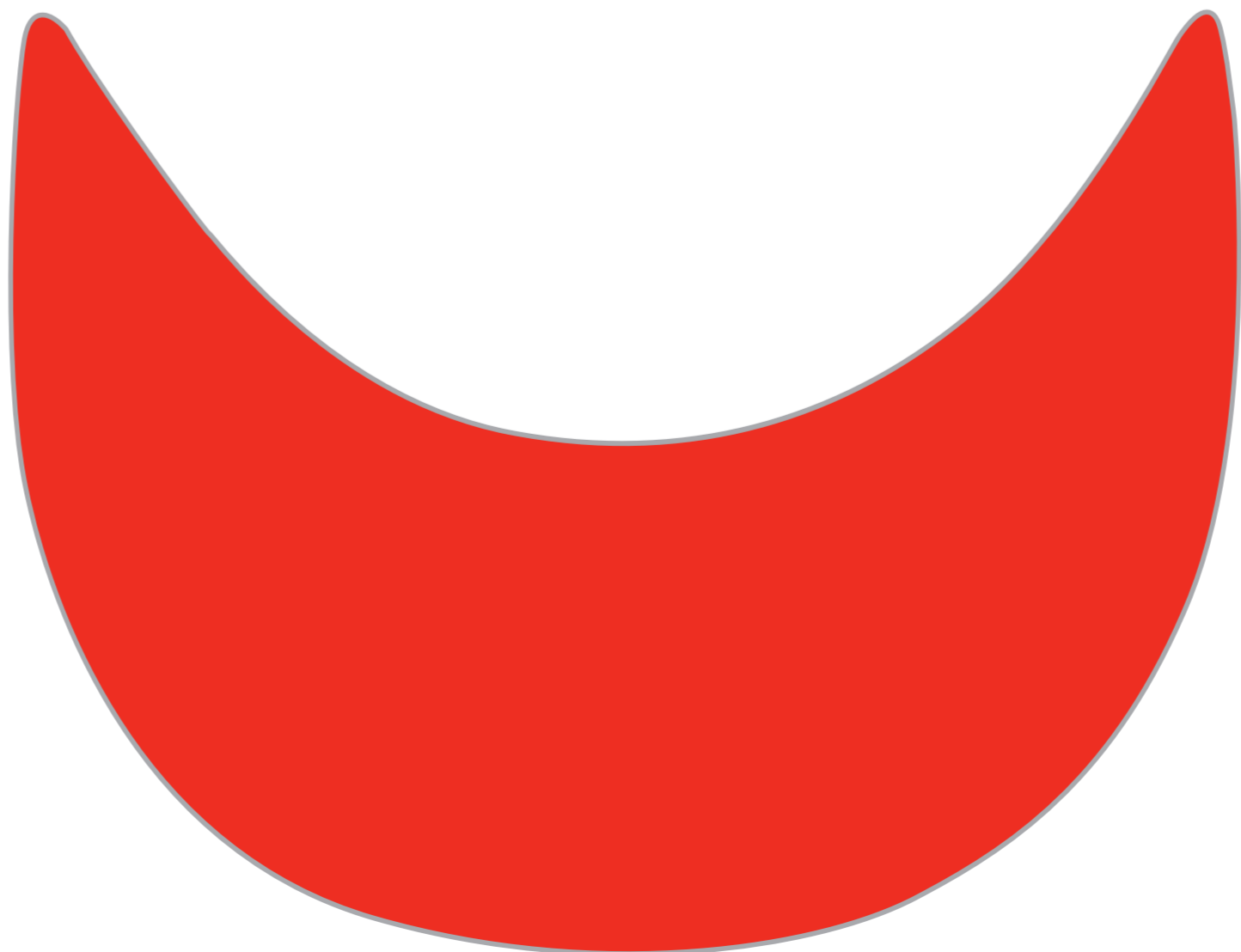
底オモテにデザインを配置