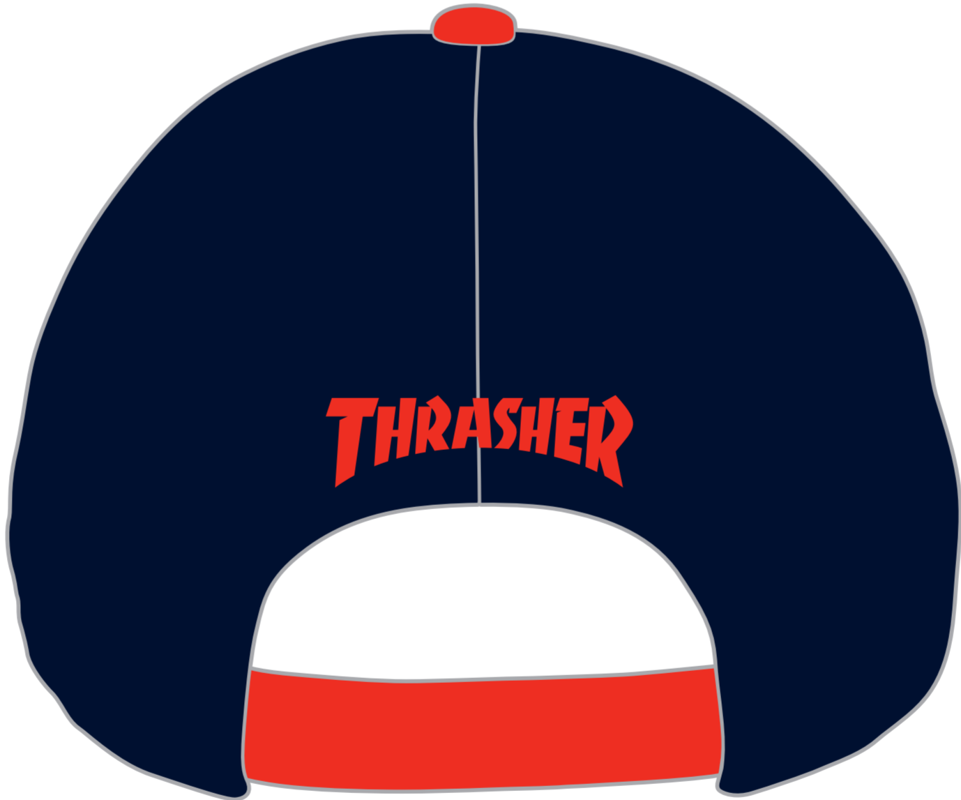
後ろから見えるデザインを配置