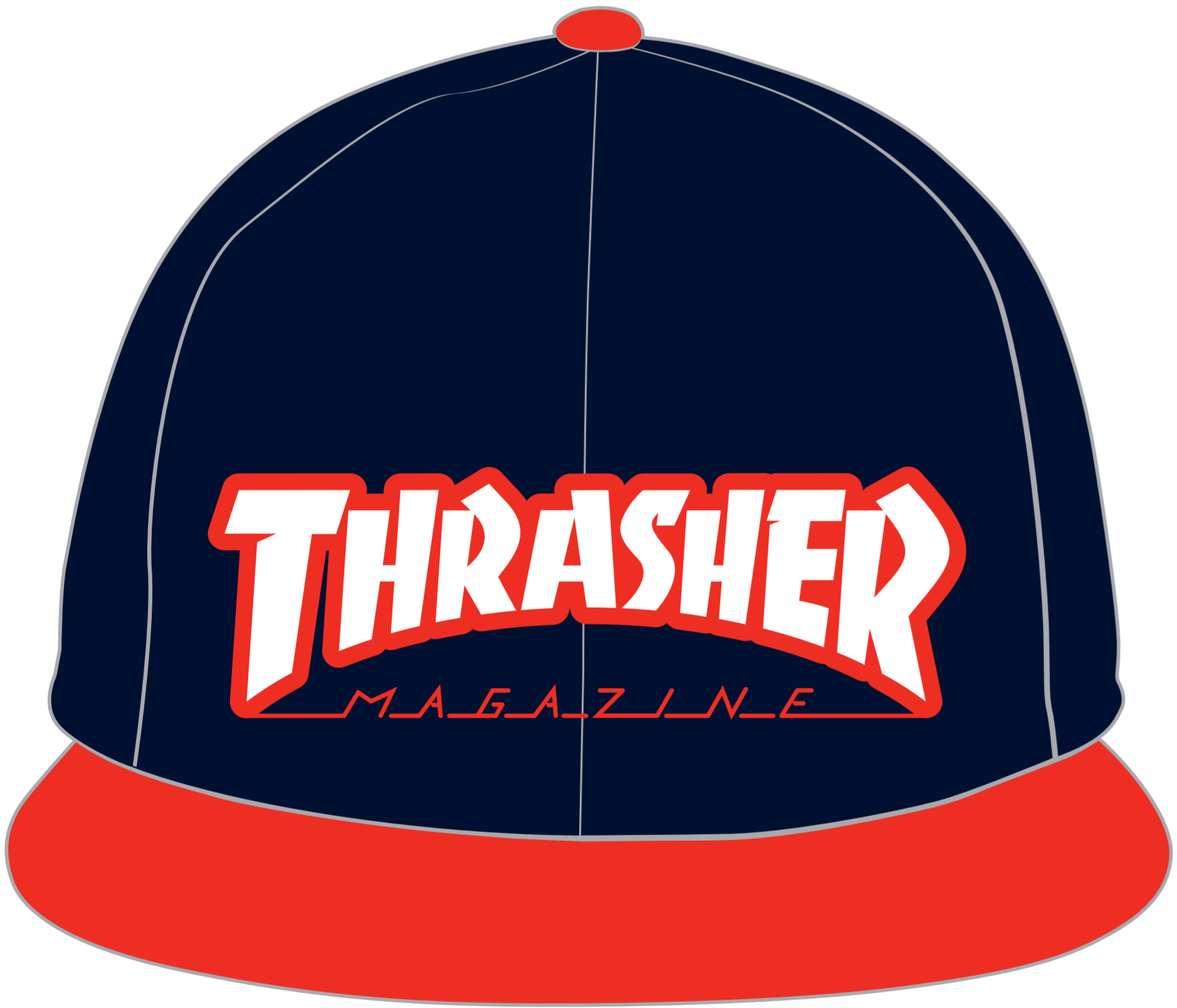
正面から見えるデザインを配置