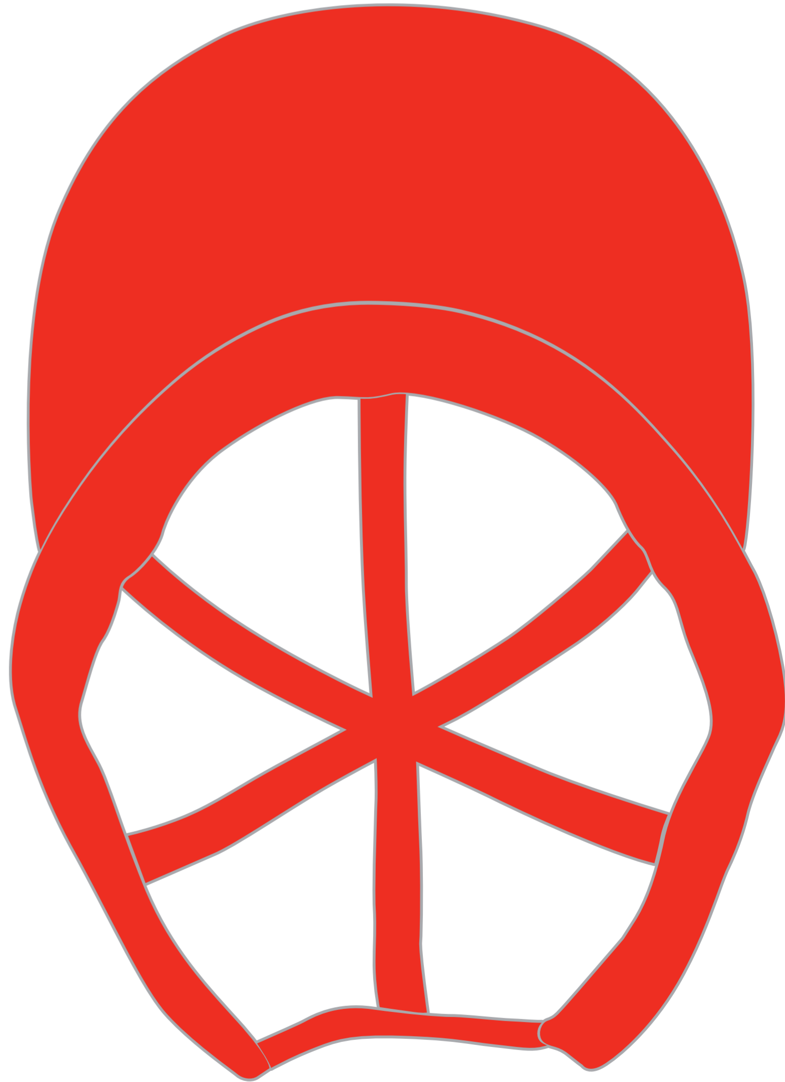
底裏にデザインを配置 帽子内側のビン皮・バイヤステープの着色